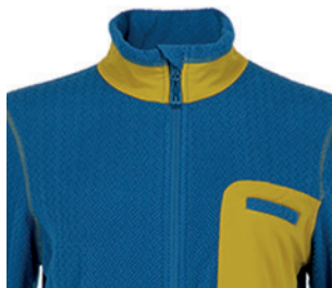
PROTECTOR DE BARBILLA