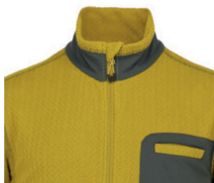
PROTECTOR DE BARBILLA