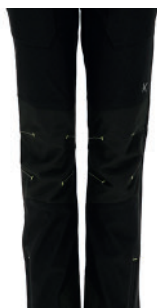
REFUERZO EN RODILLAS