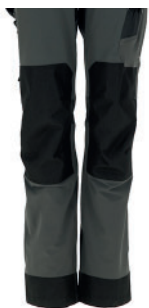
PINZAS EN RODILLAS