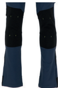
PINZAS EN RODILLAS